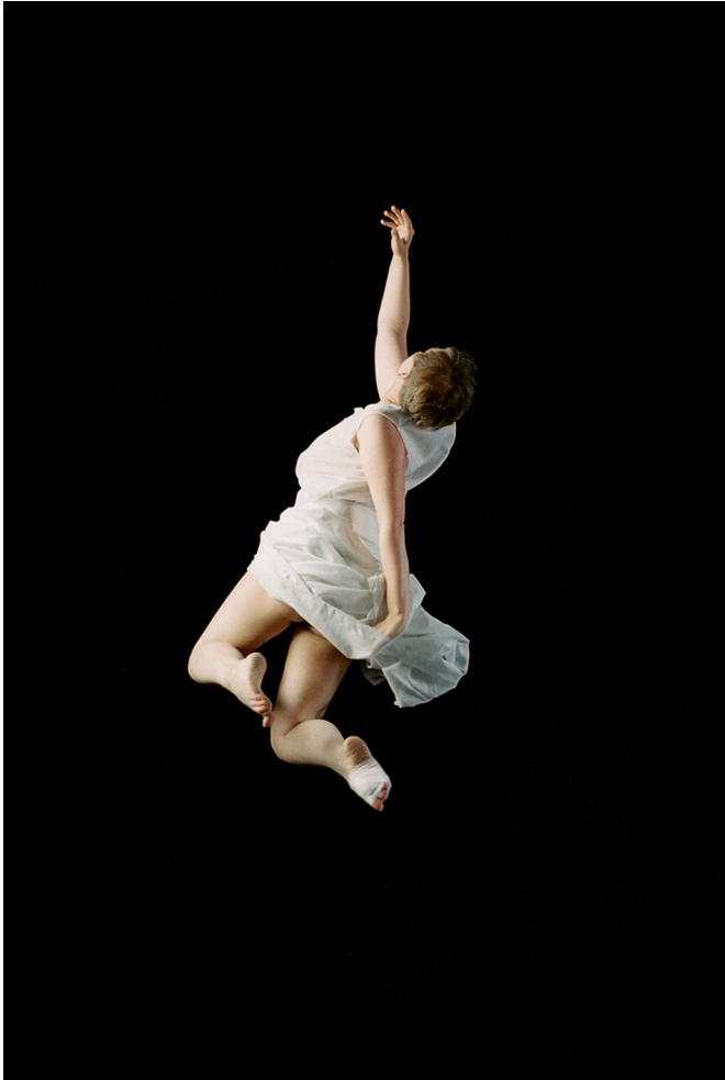
Pénélope, série photographique Héroïne, 2006